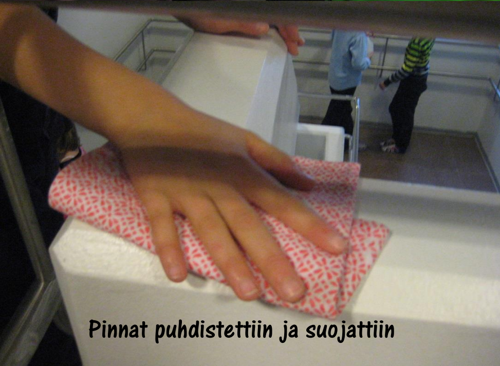
Pinnat puhdistettiin ja suojattiin