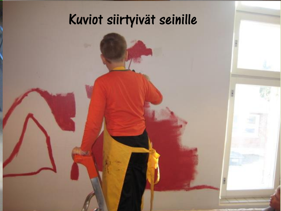
Kuviot siirtyivät seinille