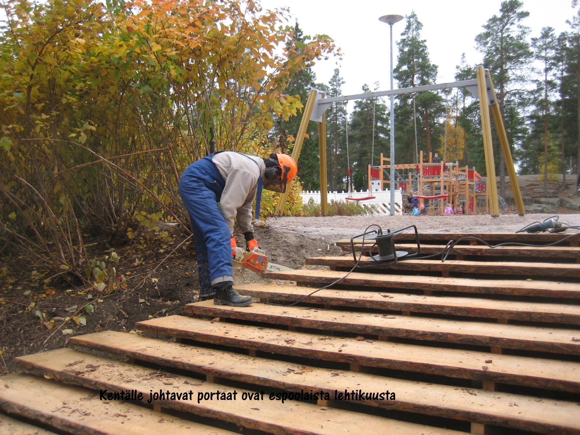
Kentälle johtavat portaat ovat espooaista lehtikuusta