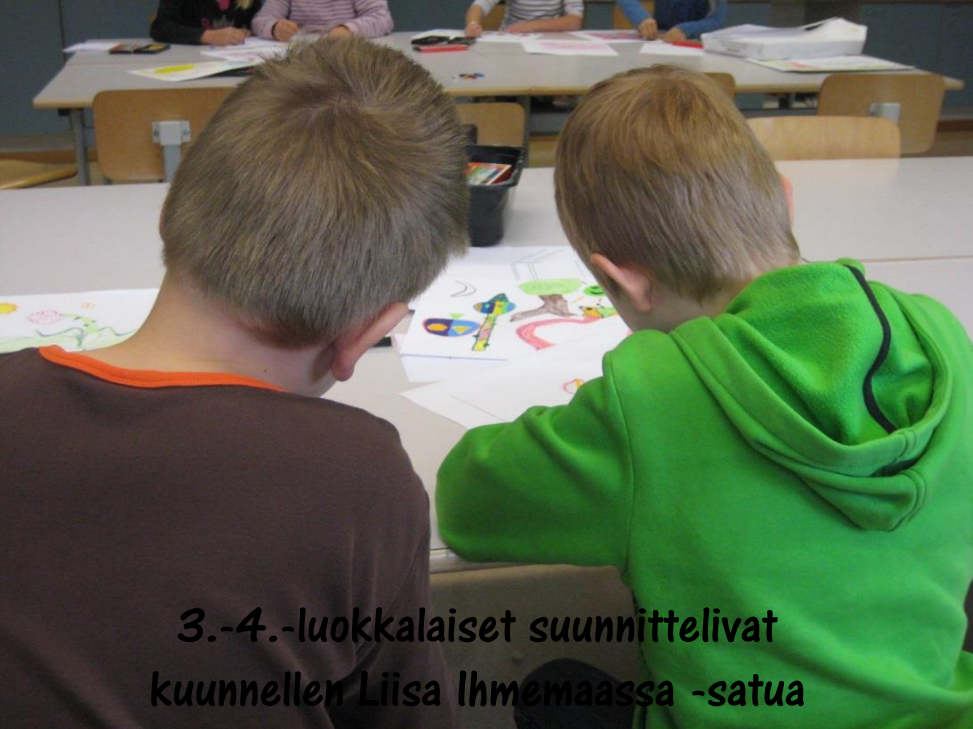
3.-4.-luokkalaiset suunnittelivat kuunnellen Liisa Ihmemaassa -satua